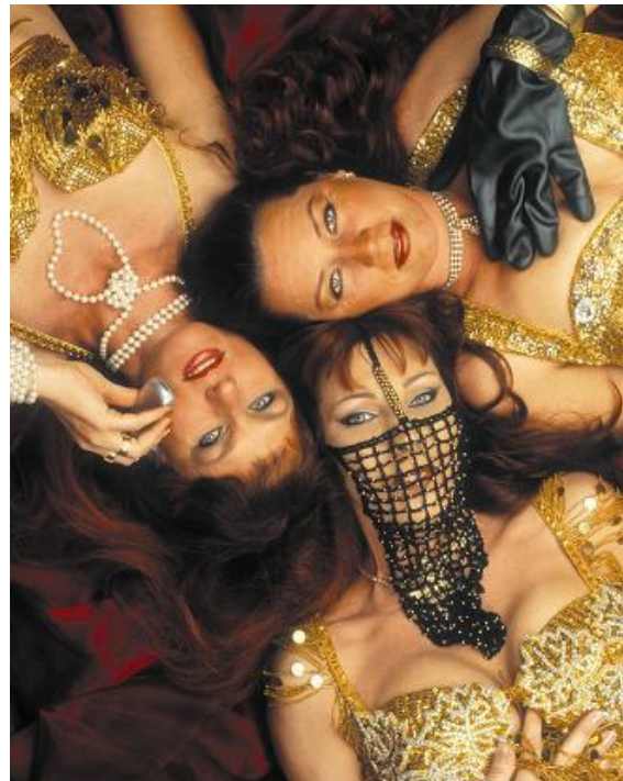
De Dalla Diva's in Henna Dilemma

het idee om een voorstelling te maken. Zo gezegd, zo gedaan. Met een beknopte aanvraag kregen we van een lokaal fonds een kleine subsidie, waarmee we deels de repetitieuimten, reiskosten, flyers, postzegels, theaterzalen, een eenvoudig lichtplan, een deel van het decor en de kostuums konden bekostigen. De overige kosten werden gedekt door de recettes. Samen met drie mannelijke dansers en onder begeleiding van een theatermaker met danservaring maakten we 'Cairo by Night'. Een voorstelling die qua verhaallijn en uitvoering veel pure oriëntaalse dans bevatte, alleen met wat meer theater, humor en drama dan normaal; een eerste geslaagde stap. Een stap die vroeg om een volgende grotere stap. Meer voorstellingen en meer kwaliteit op alle fronten: coaches, publiciteit, decor, kostuums, licht, etc. Kortom, daar was meer geld voor nodig.