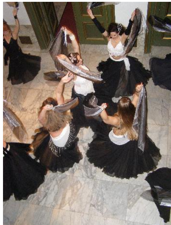
Scène uit Metamorfose .

Hoewel ik op het moment heel erg subsidiemoe ben, en me heb voorgenomen om voorlopig even geen subsidies aan te vragen, zou ik toch willen pleiten voor het aanvragen van subsidie als je de ambitie hebt om verder te gaan dan een rechttoe rechtaan voorstelling; een serie dansen achter elkaar zonder thema of verbindend element. Al was het alleen om de fondsen te laten zien dat we bestaan en dat oriëntaalse dans wel degelijk een podiumkunst (in wording) is. Het allerbelangrijkste hiervoor is dat je de artistieke doelen goed weet te verwoorden en dat je kunt laten zien hoe je met je voorstelling de dans wilt ontwikkelen. Voor 'dat wat er al is' zijn er nauwelijks tot geen subsidiemogelijkheden. Daarom: ga er eens een keer voor zitten en doe een poging. Hoe meer mooie voorstellingen er in theaters te zien zullen zijn, hoe beter voor je eigen ontwikkeling en de ontwikkeling van deze prachtige dansvorm. Wellicht kunnen we daarmee het clichébeeld op termijn naar de achtergrond verbannen en krijgt de oriëntaalse dans over niet al te lange tijd de waardering die hij verdient.