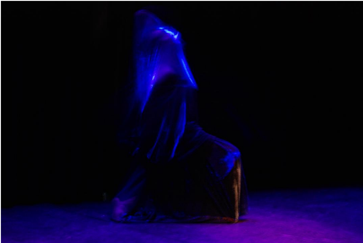
Scène uit Maktoub... ?